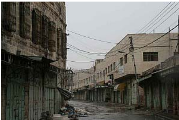
Das verlassene Zentrum von Hebron

Ein Besuch in Hebron zeigt uns das perfideste Beispiel der Siedlungspolitik. In einer Nacht und Nebel-Aktion besetzten radikale Siedler 1968 ein Haus im Zentrum von Hebron. Sie vertrieben die dort lebende palästinensische Familie und erklärten, dass das Haus ehemals in jüdischem Besitz war und es ihr Recht sei, dieses Haus wieder in jüdischen Besitz zu nehmen. Obwohl die ursprünglichen Besitzer, die mittlerweile in die USA emigriert waren, in einem Brief erklärten, dass sie die Inbesitznahme der Siedler