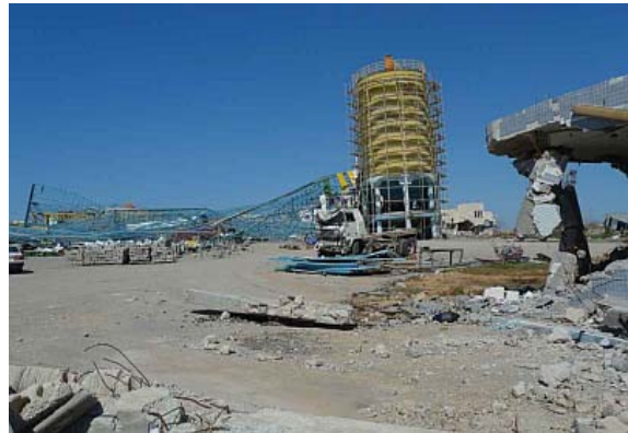
Zerstörter Turm der Zementabfüllungsanlage

Lokale wie internationale Organisationen berichten uns, dass vieles darauf hinweist, dass das israelische Militär sich in Gaza Kriegsverbrechen schuldig gemacht hat. Das United Nations Office for the Coordination of Humanitarian Affairs (UN OCHA) dokumentiert eine Reihe von Vorfällen, die die Verhältnismäßigkeit der eingesetzten Mittel und die Respektierung des Internationalen Rechts mehr als in Frage stellen, unter ihnen die Bombardierung eines Gebäudes in Gaza Stadt am 5. Januar, bei dem 22 Zivilisten