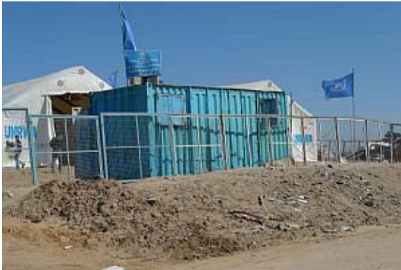
UNRWA Lebensmittellager und Unterkünfte

sind die Grenzen weiterhin dicht. Die israelische Regierung blockiert weiterhin eine ausreichende Versorgung der Bevölkerung mit den allernötigsten Hilfsgütern.