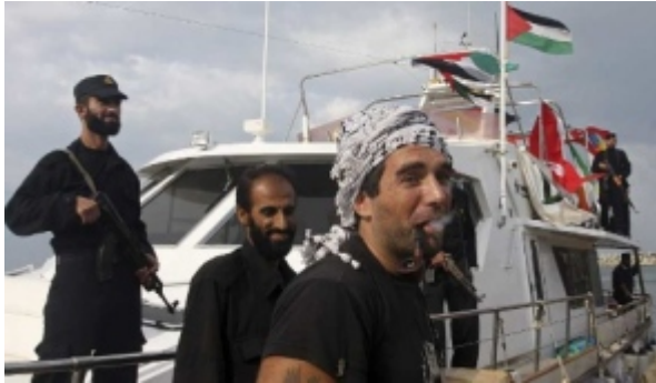
Executed Italian Palestinian activist

In der Tat, wem hilft dieser Mord an einem Friedensaktivisten, der sich selbst als Pazifist bezeichnete und in Gaza seit 2008 mit friedlichen Mitteln dem palästinensischen Volk half, sich gegen den alltäglichen Terror des israelischen Apartheidstaates zu verteidigen.